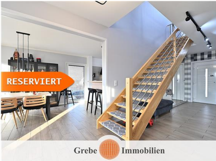
Zugang zum DG