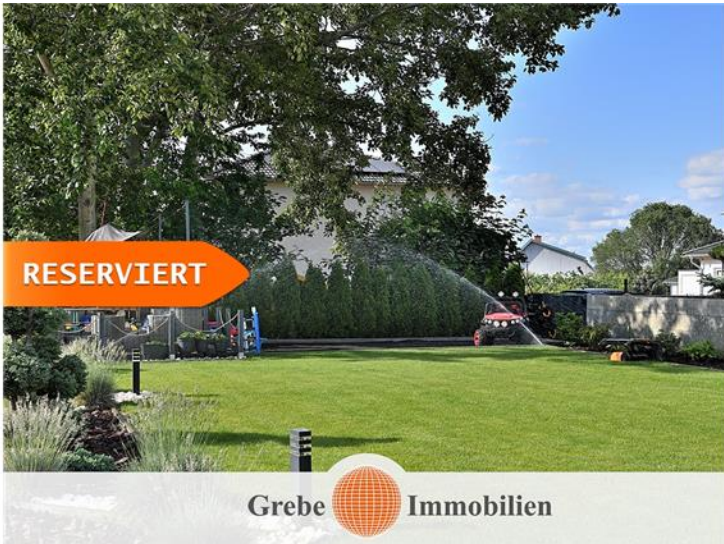
Garten Bild 2