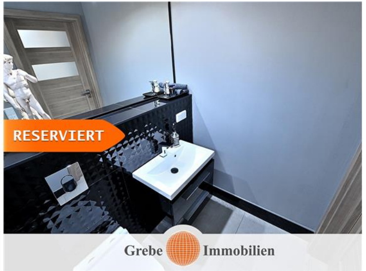
Gäste WC im EG