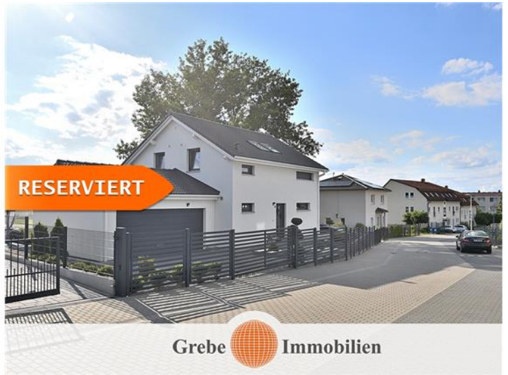
EFH zum Kauf Zossen