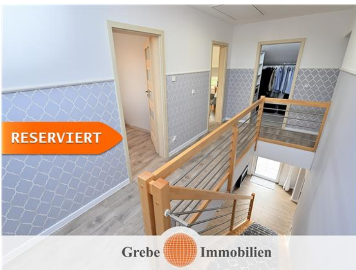
Willkommen im DG