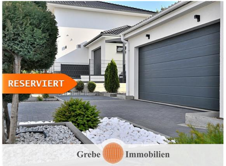
... mit Doppelgarage