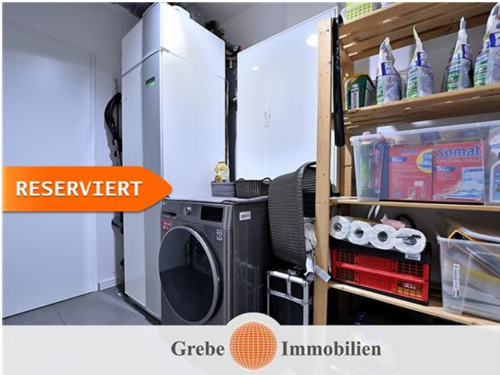
HWR im EG mit Zugang zur Garage