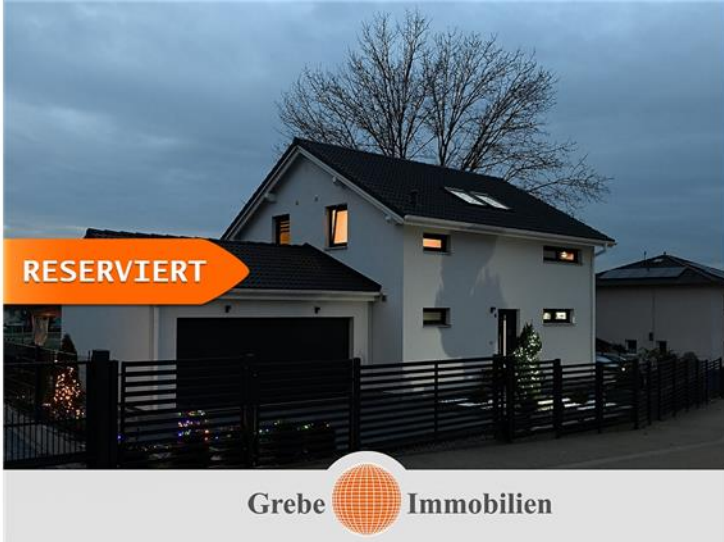
Abenddämmerung im Zillebogen