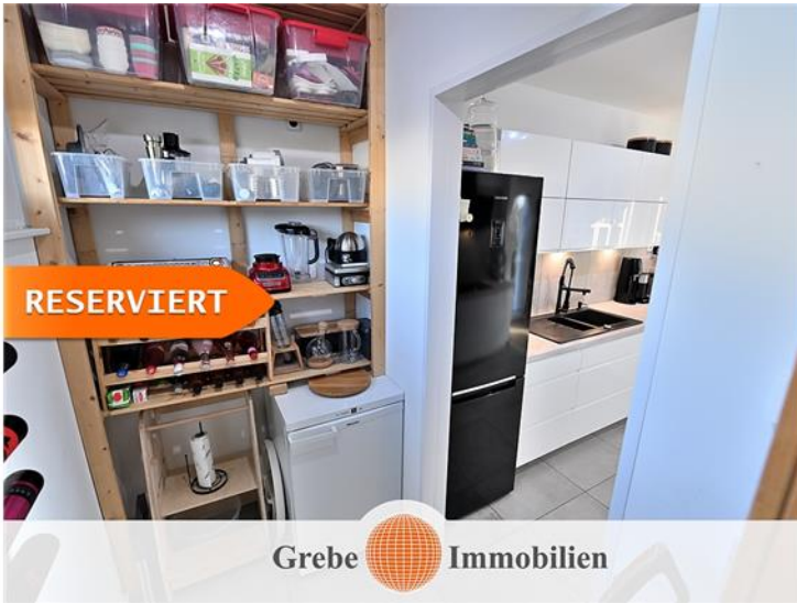
Speisekammer Bild 2