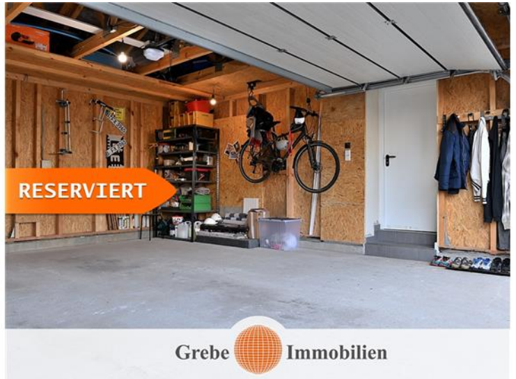
Doppelgarage mit Hauszugang