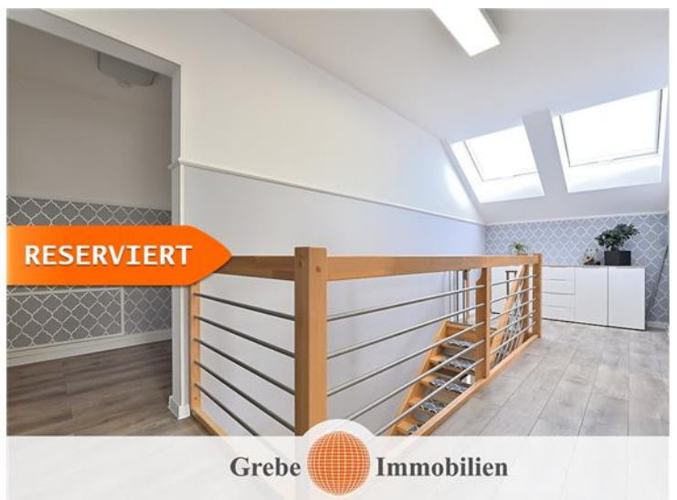
Flur im DG