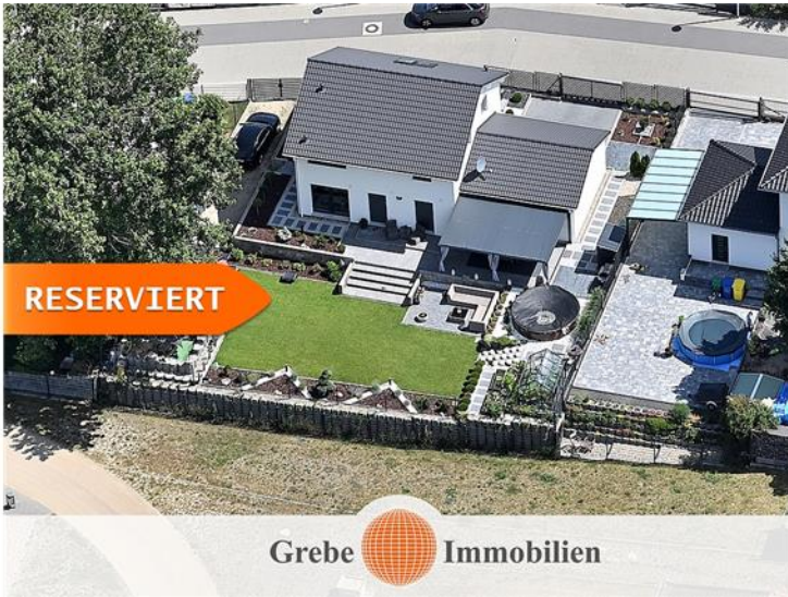
Aus der Luft