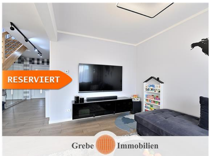
Familienzentrum Bild 2