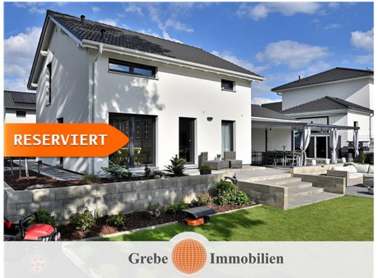
Zugang vom Familienzentrum