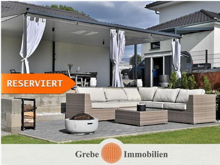
Sitzecke mit Feuerplatz