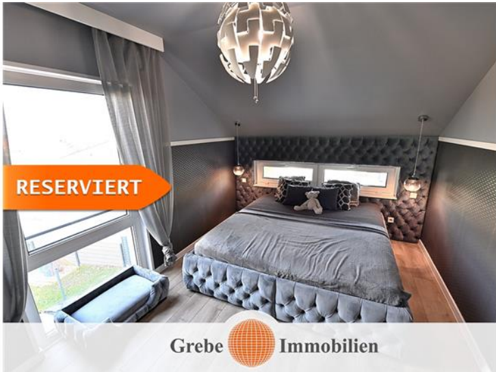
Schlafzimmer mit ...