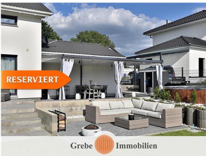
Sitzecke mit Feuerplatz_