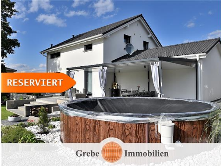
... und Pool