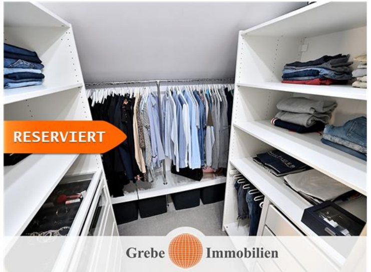
... begehbarem Kleiderschrank